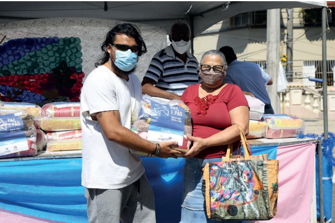
A Campanha Paz e Pão foi lançada em 2019, em meio à pandemia de covid-19

Paróquias localizadas nos territórios de maior vulnerabilidade social.